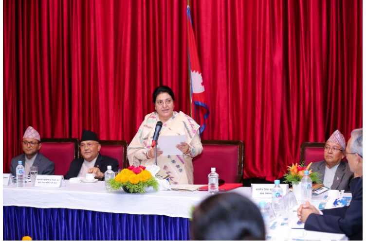
कार्यक्रममा सम्बोधन गर्नुहुँदै सम्माननीय राष्ट्रपति श्री विद्यादेवी भण्डारी

यहाँहरू सबैलाई राष्ट्रपति भवन, शीतलनिवासमा स्वागत गर्ने अवसर मिलेकोमा खुशी लागेको छ । यस कार्यक्रममा सहभागी हुनुहुने सबैलाई हार्दिक धन्यवाद भन्न चाहन्छु । संबैधानिक अंगको रूपमा रहेको निर्वाचन आयोगले निर्वाचन समीक्षा तथा आयोगको भावी रणनीति सम्बन्धी उच्चस्तरीय अन्तरक्रिया कार्यक्रम आयोजना गरेकोमा सराहना गर्दछु ।